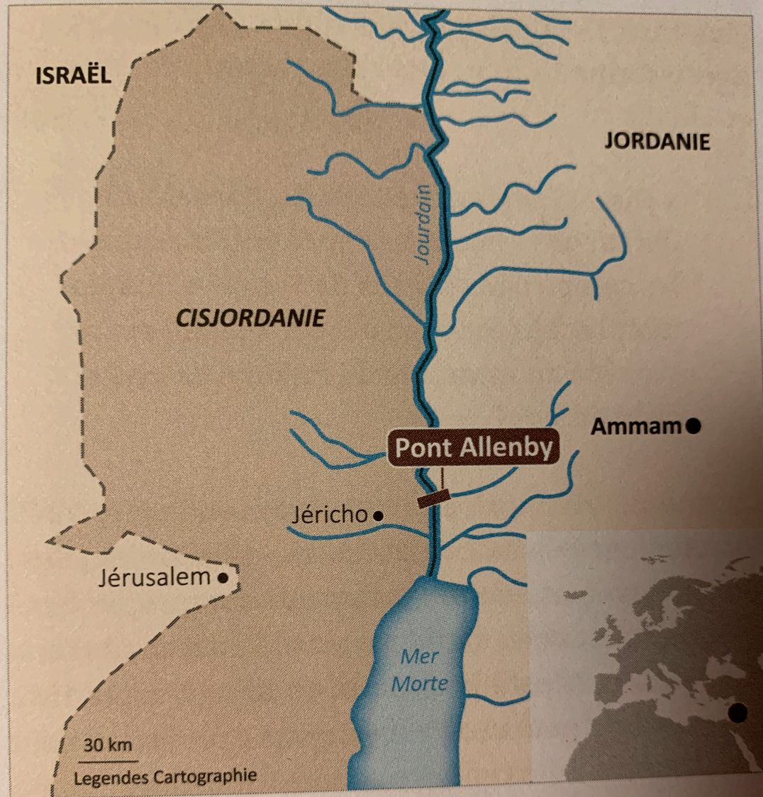
Carte montrant le fleuve Jourdain constituant la frontière israélo-palestinienne. © Légendes Cartographie