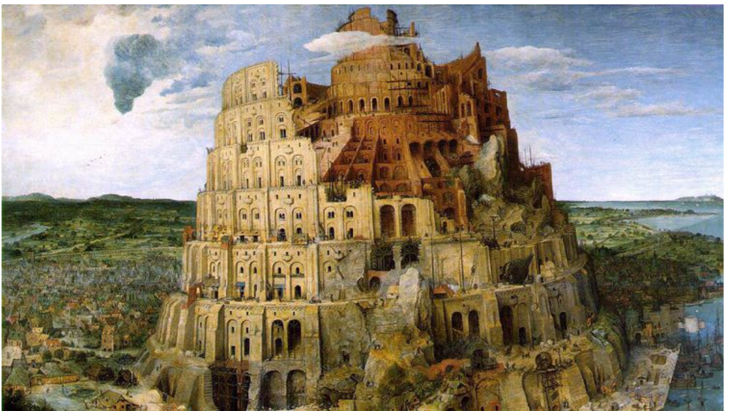
Pieter Bruegel l'ancien, La Tour de Babel , huile sur panneau de chêne, 1563, musée de Vienne