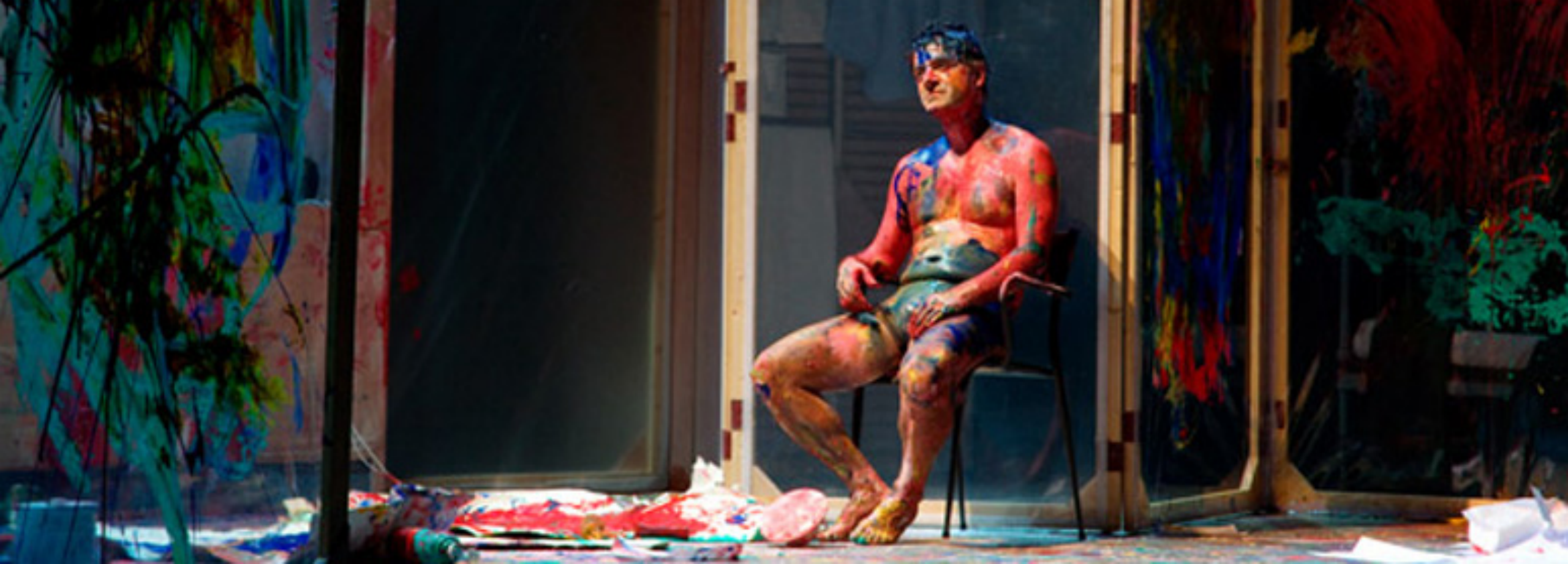
Seuls , texte et interprétation W. Mouawad, Théâtre national de la Colline, 2016