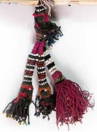
CARNET DE VOYAGES