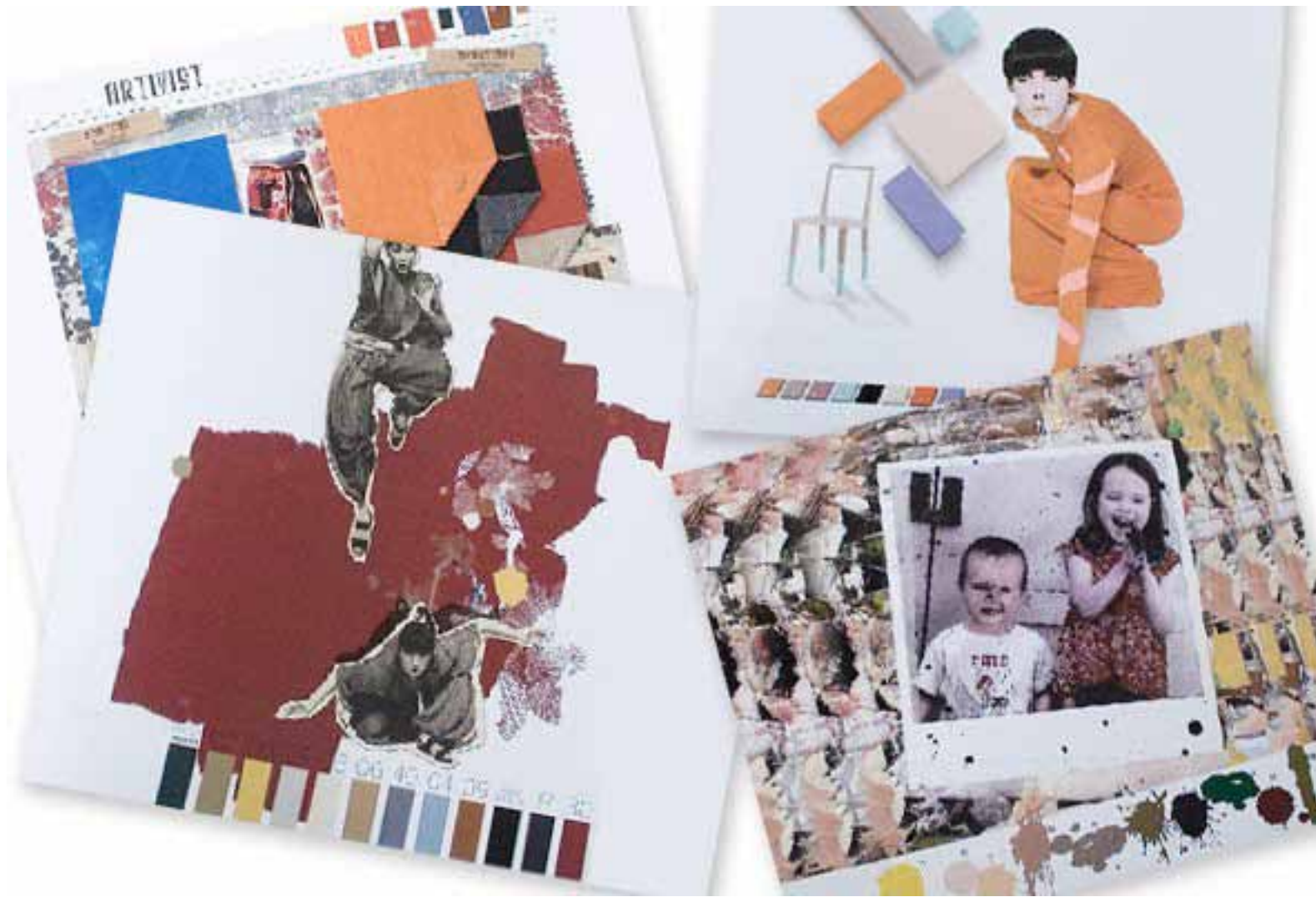
CAHIER DE TENDANCES (MODE)