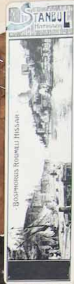
CARNET DE VOYAGES