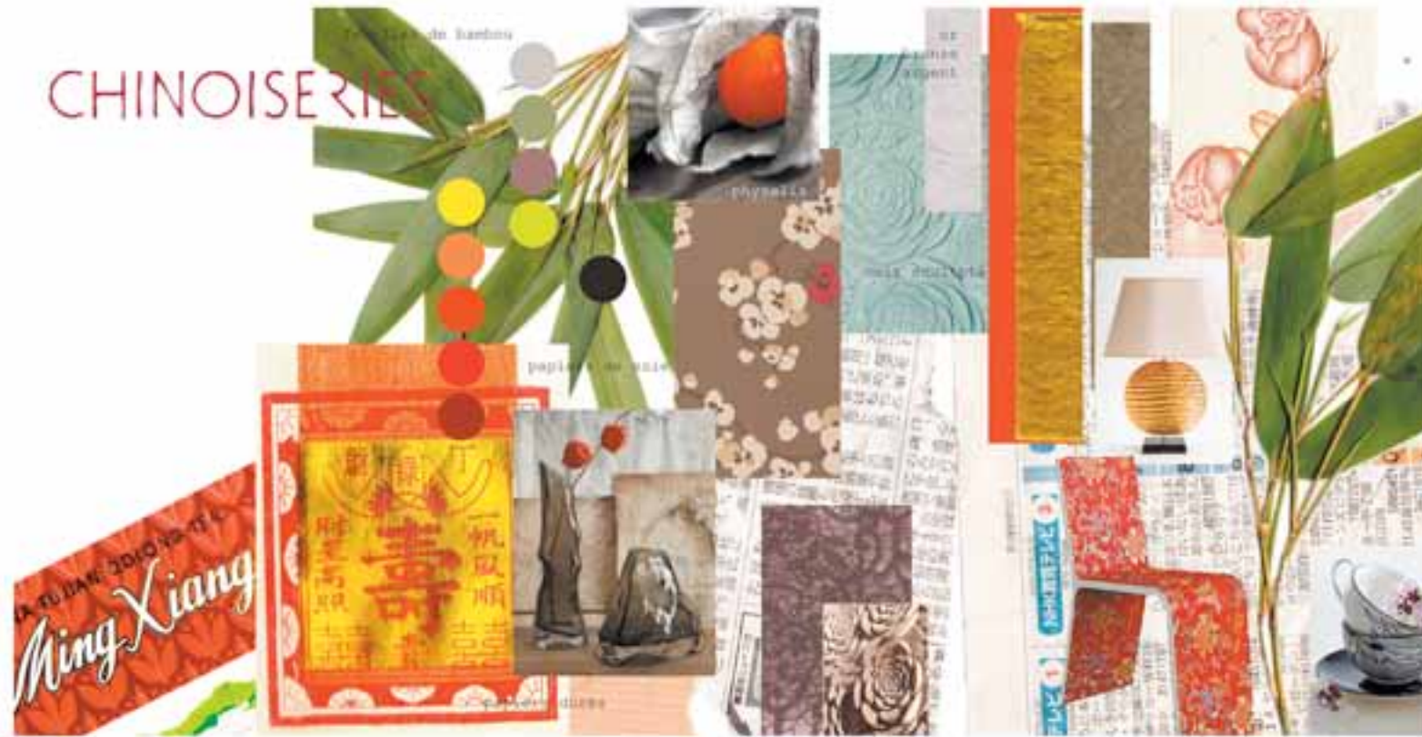
CAHIER DE TENDANCES (MODE)