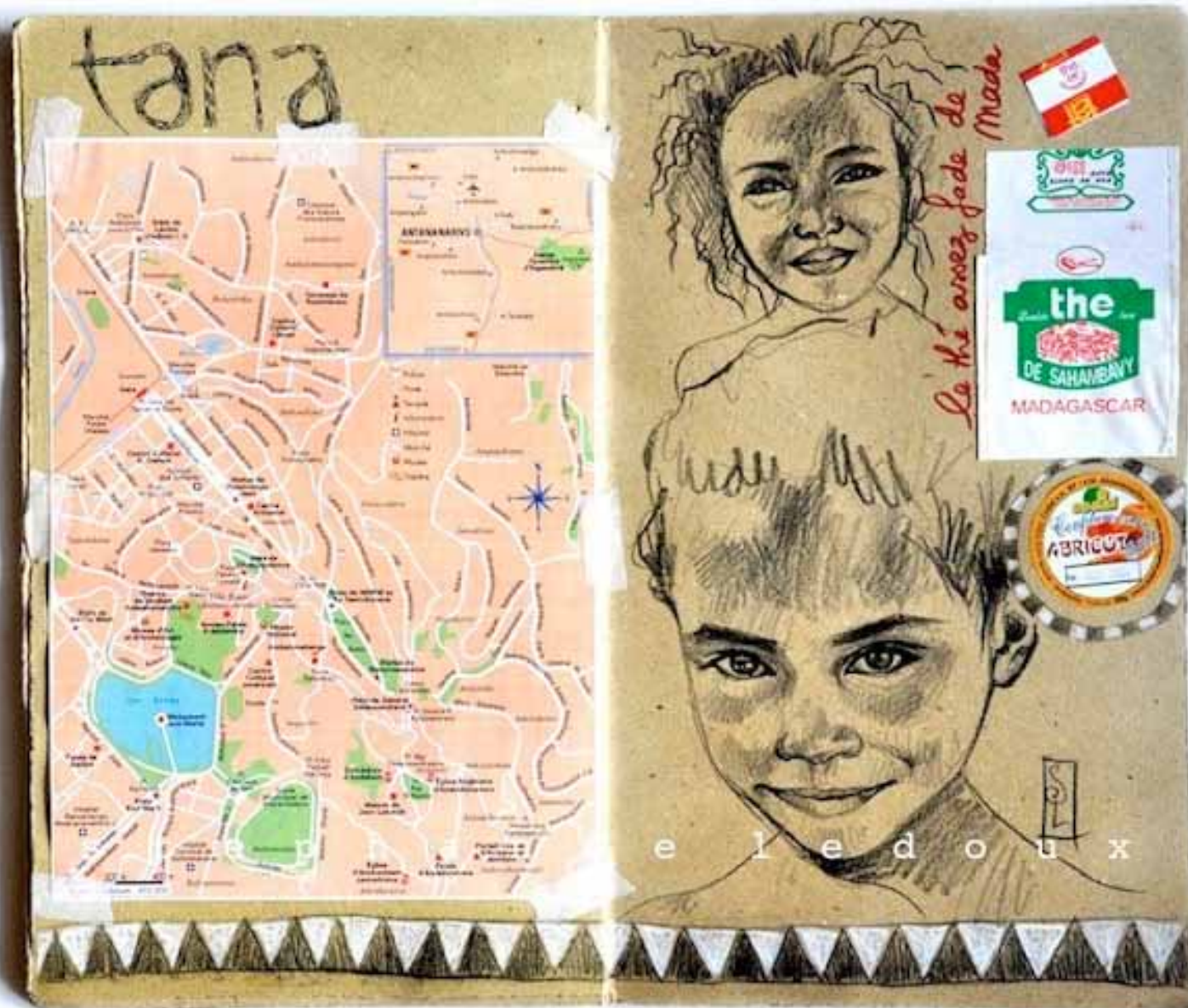
CARNET DE VOYAGES